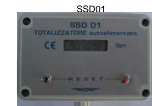
PRODUZIONE PANNELLI : LAB. MENZAGO