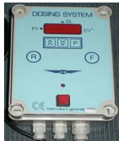
T & F