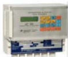
VISUALIZZATO, VERSIONE HI-TECH, PER MONTAGGIO IN CAMPO O ENTRO QUADRO

IL PROGRAMMATORE VISUALIZZATORE CHE SI ACQUISTA SCEGLIENDO SOLO LE FUNZIONI CHE EFFETTIVAMENTE SERVONO LA VERSIONE STANDARD E' FORMATA DALLA BASE + D) +E)+Y)+M)