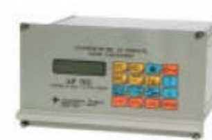
VISUALIZZATO, VERSIONE HI-TECH, PER MONTAGGIO FRONTE QUADRO

LA SOLUZIONE PIU' VANTAGGIOSA PER IL DOSAGGIO DI QUALSIASI FLUIDO ELETTRICAMENTE CONDUCIBILE